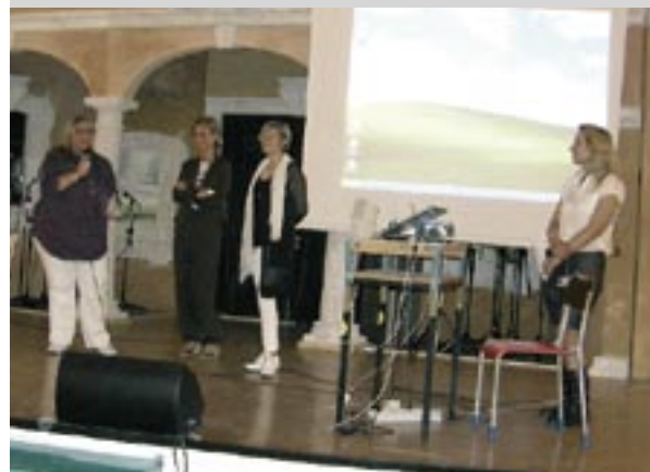
Giugno 2010. Un momento della manifestazione di educazione alle legalità con cui si è chiuso lo scorso anno scolastico

L'Associazione Valeria, in collaborazione con la Direzione Didattica delle Scuole cerresi e l'assessorato Servizi alla Persona, Famiglie e Politiche di Genere, ha tenuto presso le classi delle medie inferiori alcune " Lezioni sulla legalità ", ed in particolare sui diritti e doveri delle ragazze e dei ragazzi. L'iniziativa ha suscitato un sensibile interesse nei ragazzi la cui attenta partecipazione ha manifestato il forte bisogno di chiarezza presente negli adolescenti d'oggi. Altrettanto interesse hanno suscitato gli " Incontri formativi svolti con le insegnanti " delle classi che vanno dalla scuola dell'infanzia alle scuole medie; l'obiettivo di questi incontri è stato quello di fornire conoscenza specifiche sulle problematiche dei minori spesso dovute a situazioni di ansia, inquietudine e disagio e rendere gli insegnanti consapevoli delle proprie responsabilità. Prosegue, presso il Comune, l'attività dello Sportello Giuridico , che ha riaperto a settembre dopo la pausa estiva. Le prossime date di apertura dello sportello sono: 19 ottobre, 16 novembre e 14 dicembre dalle ore 16.00 presso la Biblioteca Civica "O. Fallaci" .