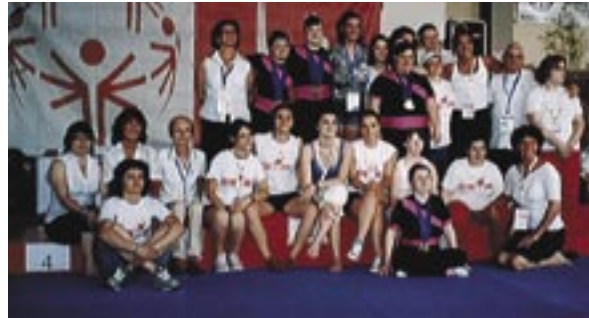
Monza Campionati estivi nazionali 2010 - Special Olympics, le atlete della ginnastica ritmica della Castoro Sport

Attualmente con i suoi 80 soci nelle discipline della ginnastica ritmica, nuoto e pallacanestro , tutti tesserati Coni e/o Special Olympics, Castoro Sport è tra le società più medagliate della Federazione Italiana Sport Disabili, grazie ai suoi cestisti e alle ginnaste. Per citare il successo